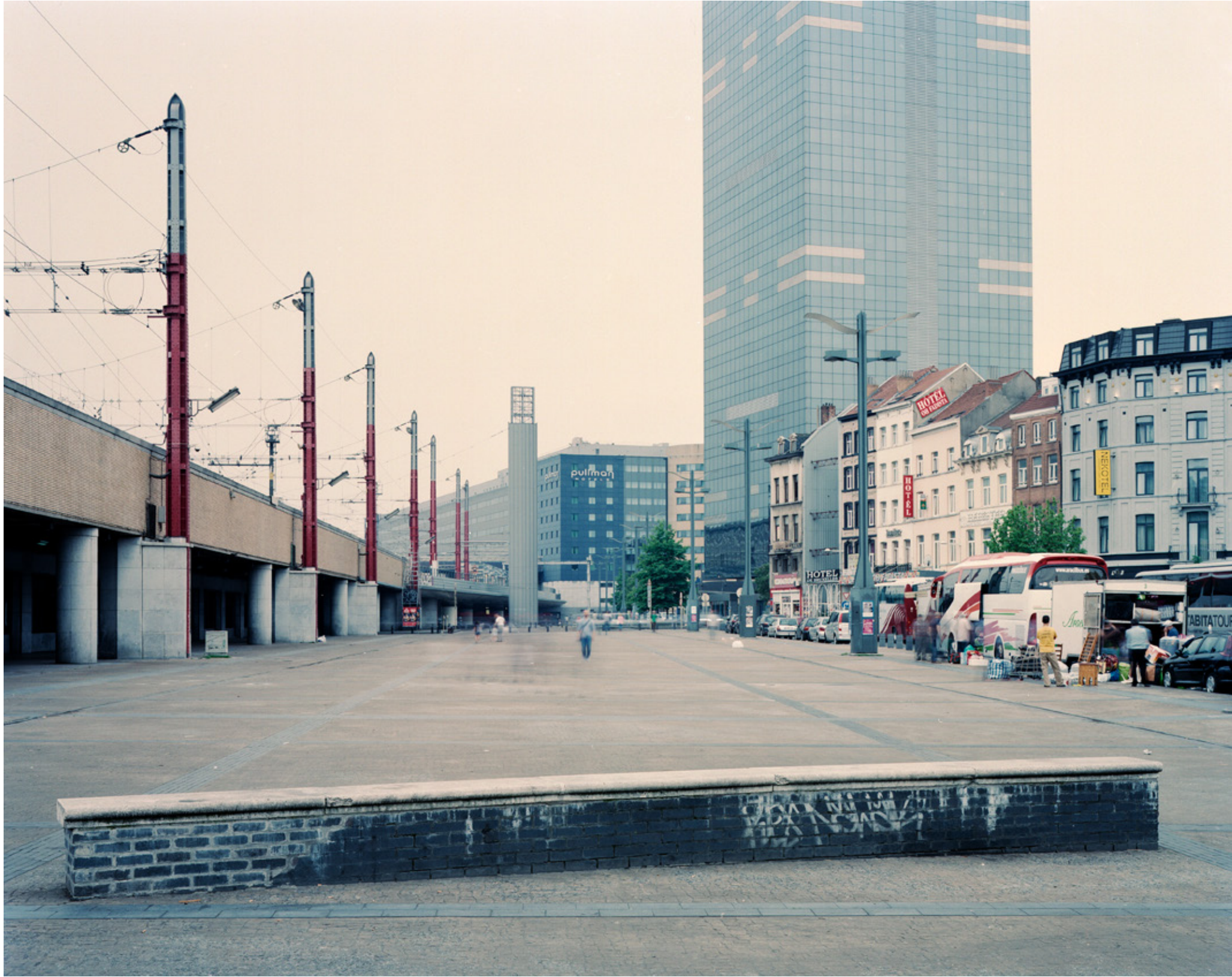
BRUXELLES_ 2017 PLAN CANAL #031 - 2017