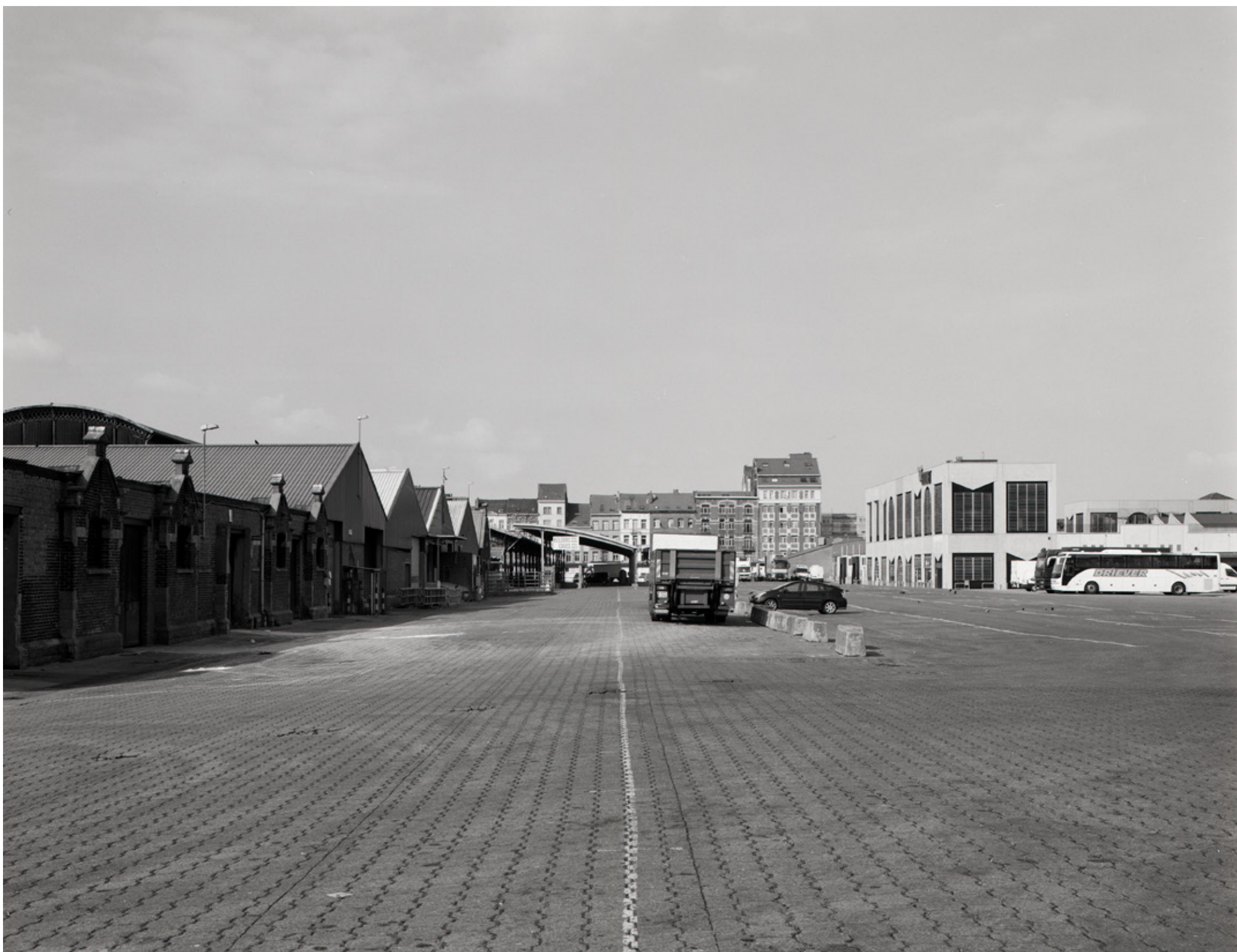
BRUXELLES_2017 PLAN CANAL #030 - 2017