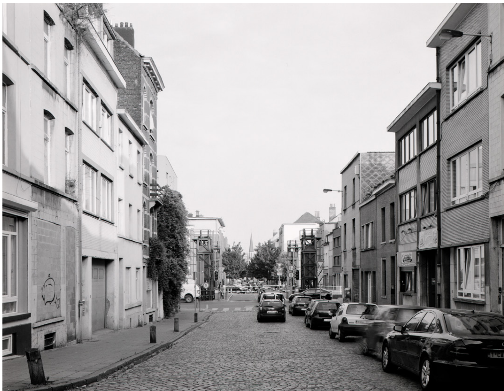
BRUXELLES_2017 PLAN CANAL #024 - 2017