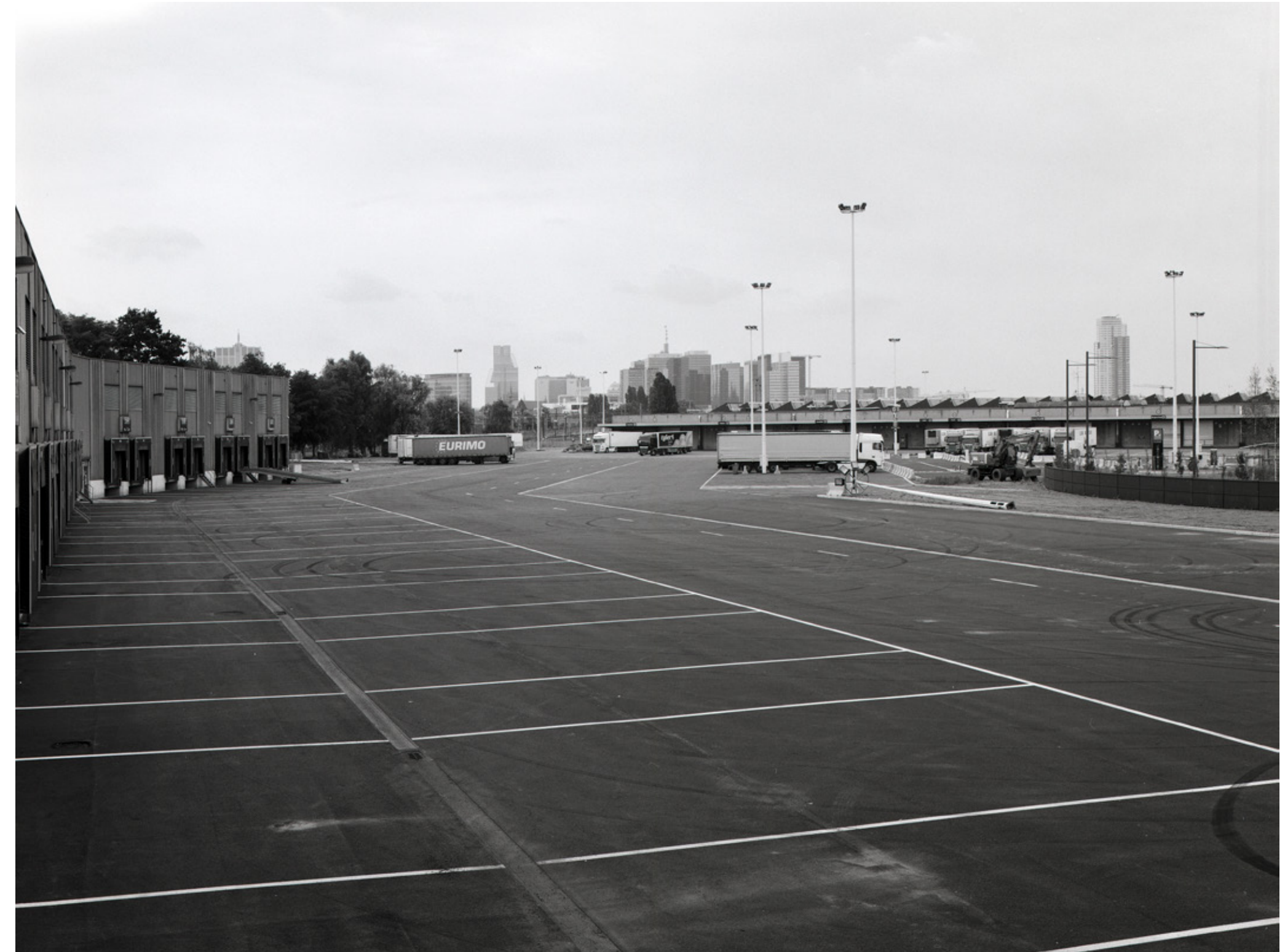
BRUXELLES_2017 PLAN CANAL #008 - 2017