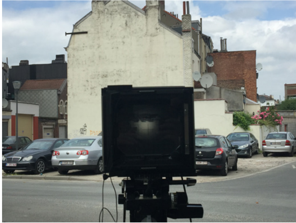
BRUXELLES_ 2017 PLAN CANAL #033 - 2017