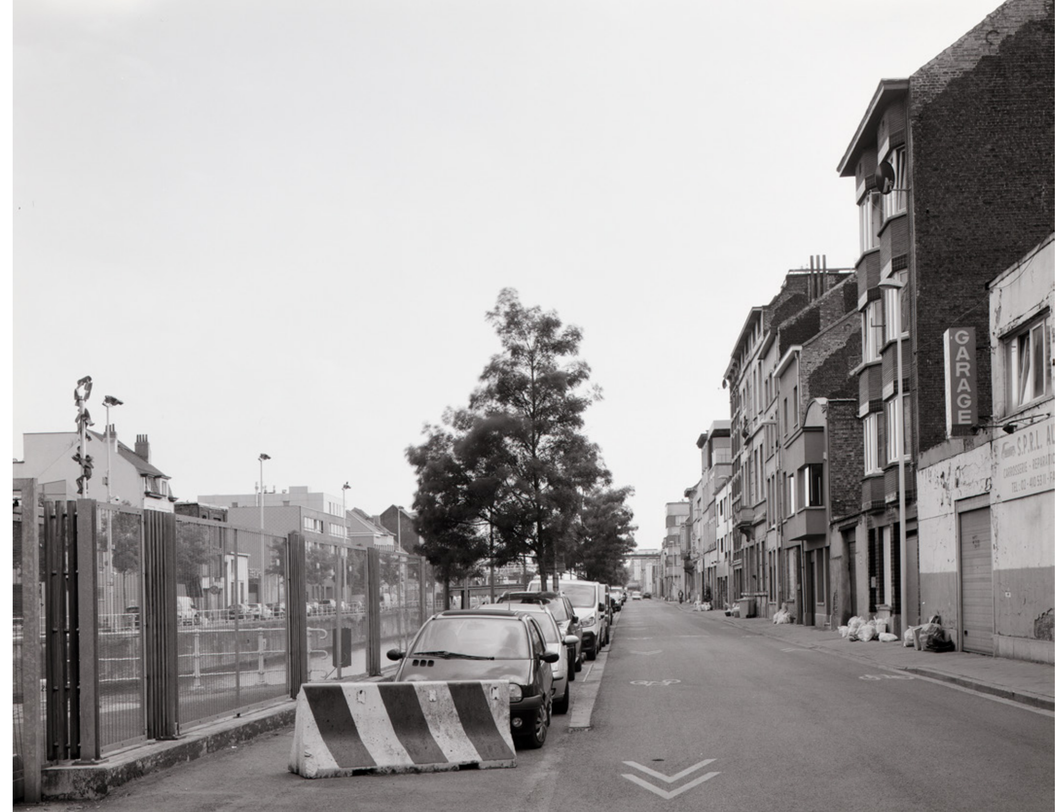
BRUXELLES_2017 PLAN CANAL #016 - 2017