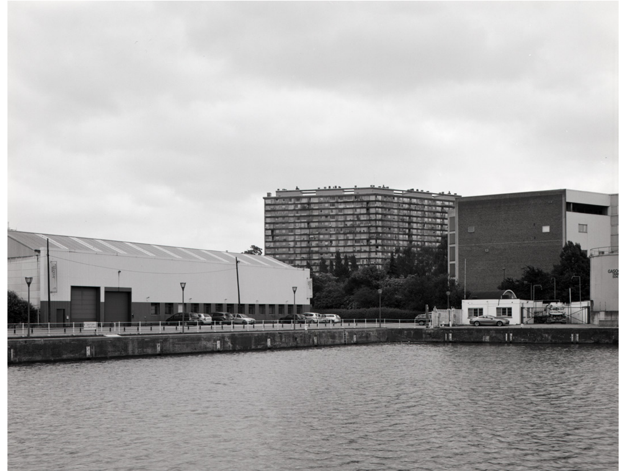
BRUXELLES_ 2017 PLAN CANAL #020 - 2017