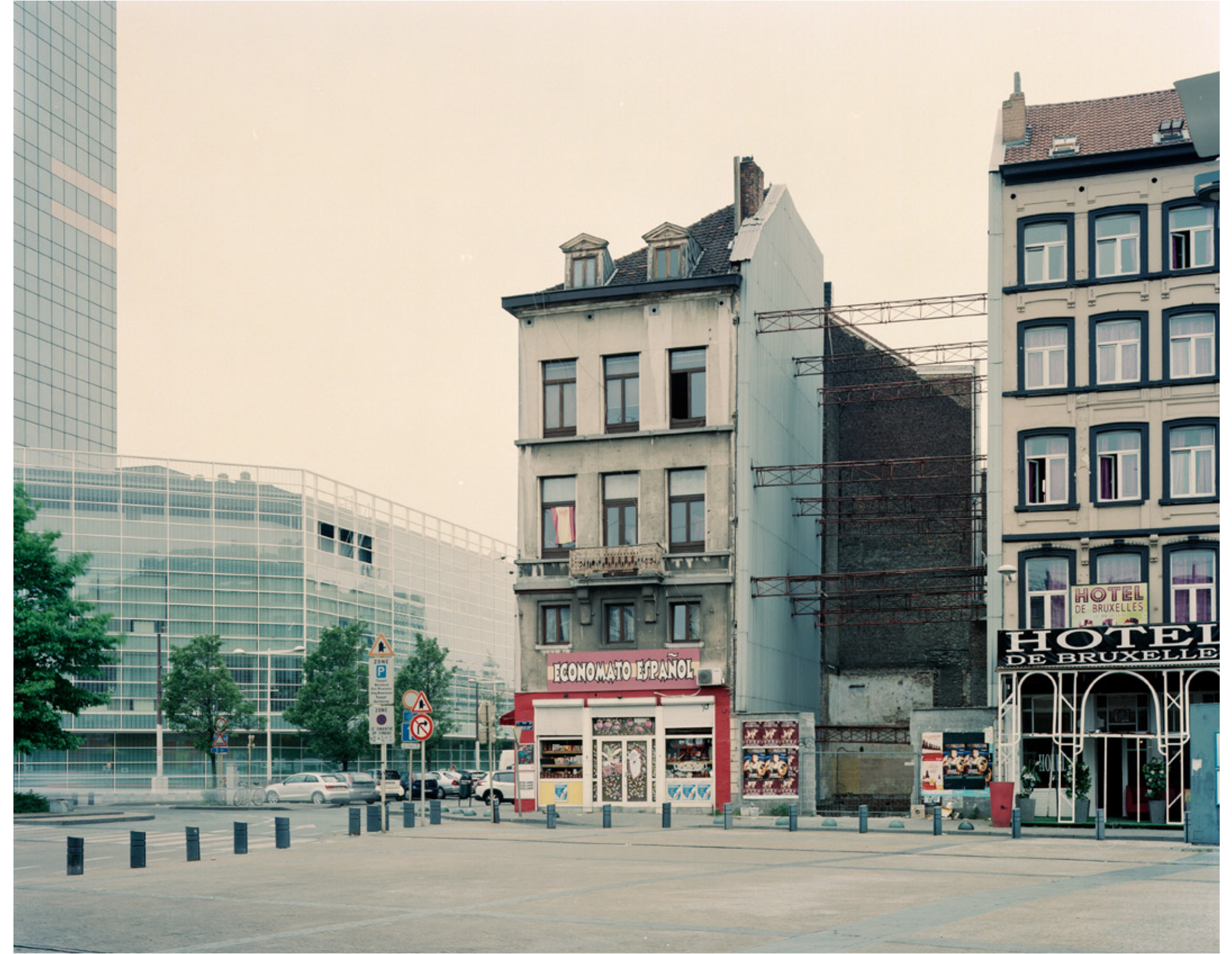
BRUXELLES_ 2017 PLAN CANAL #037 - 2017