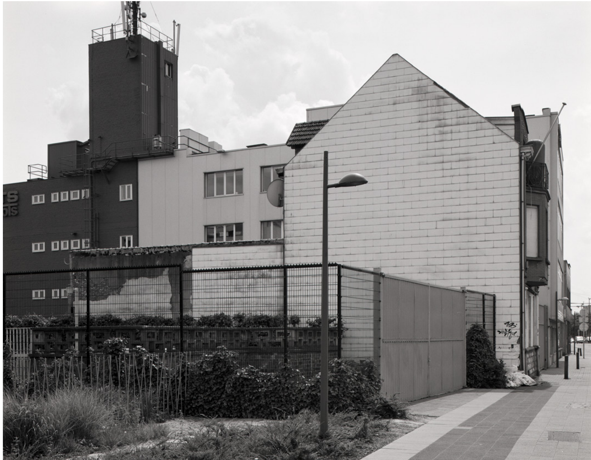
BRUXELLES_2017 PLAN CANAL #015 - 2017