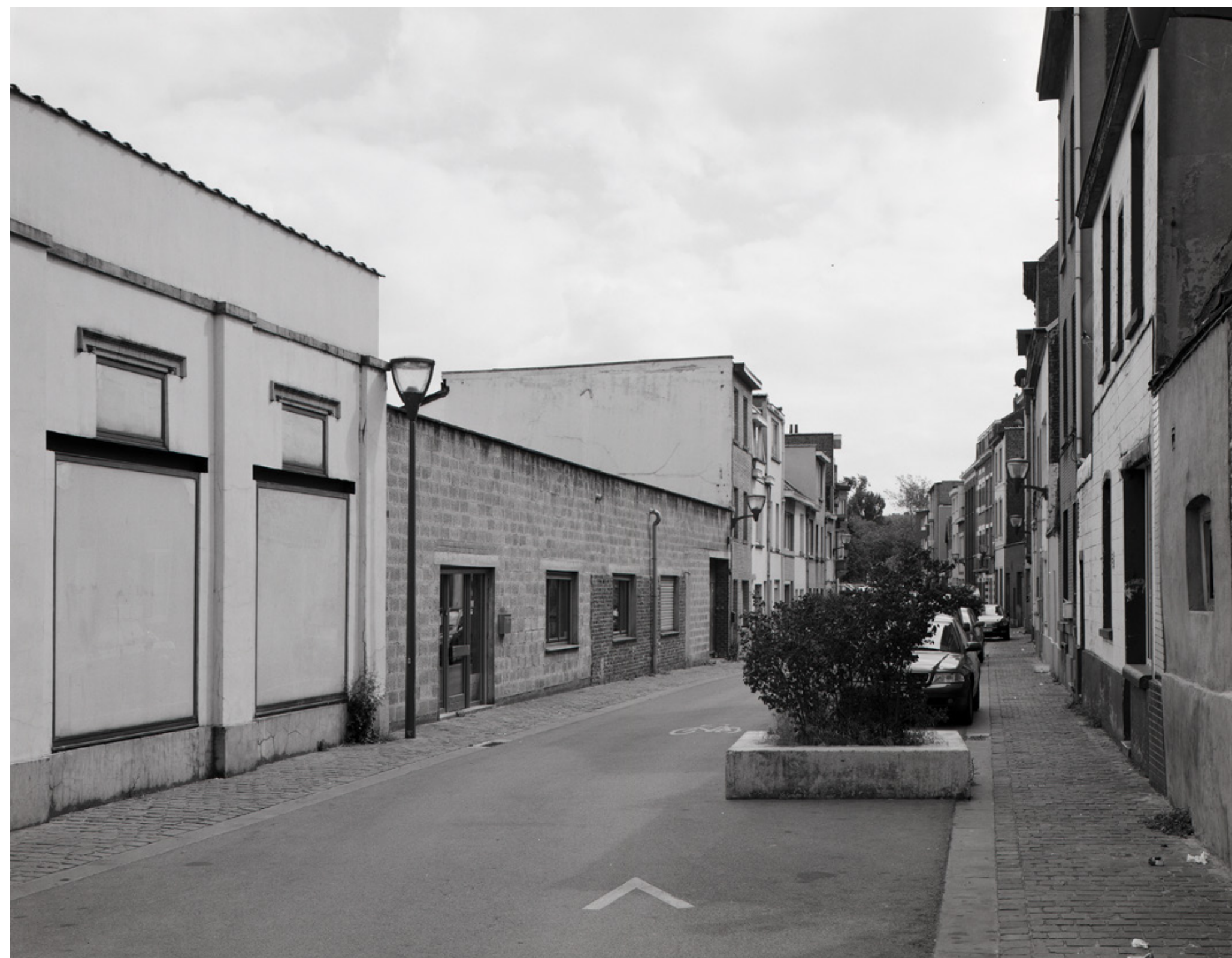
BRUXELLES_2017 PLAN CANAL #027 - 2017