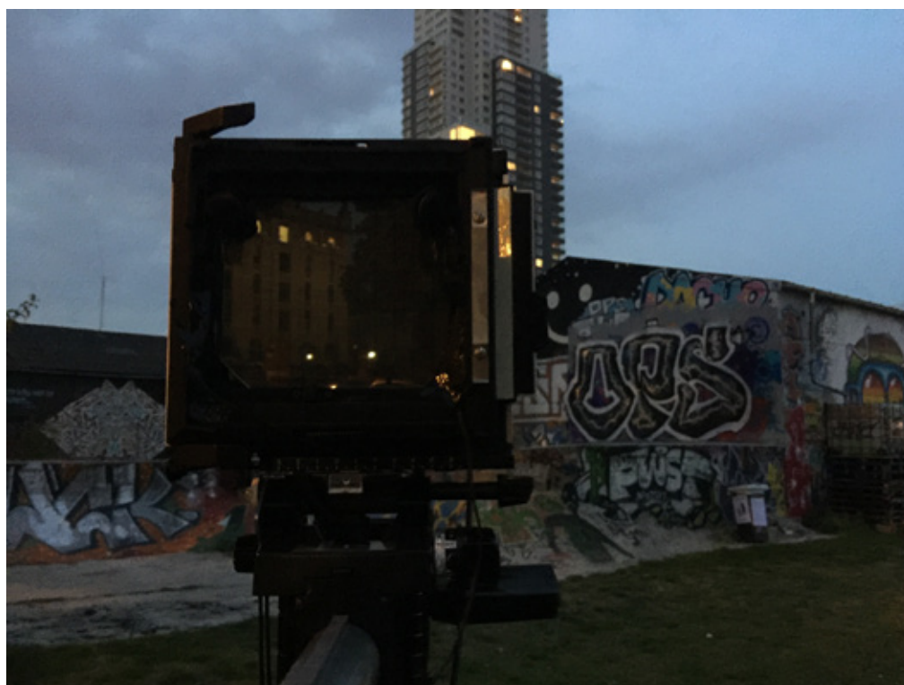
BRUXELLES_2017 PLAN CANAL #002 - 2017