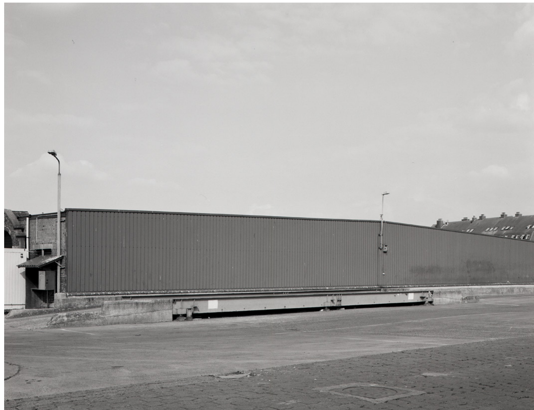
BRUXELLES_2017 PLAN CANAL #029 - 2017