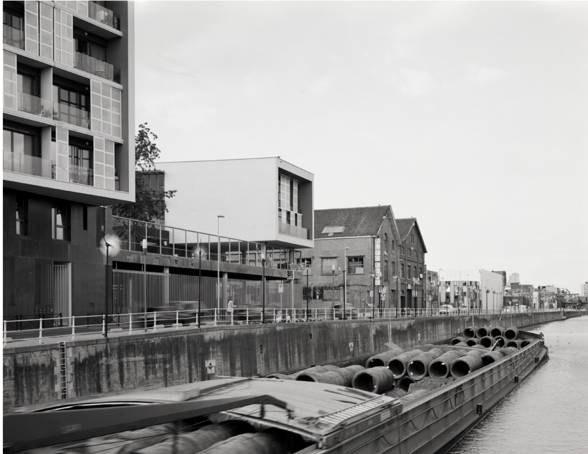
BRUXELLES_ 2017 PLAN CANAL #028 - 2017