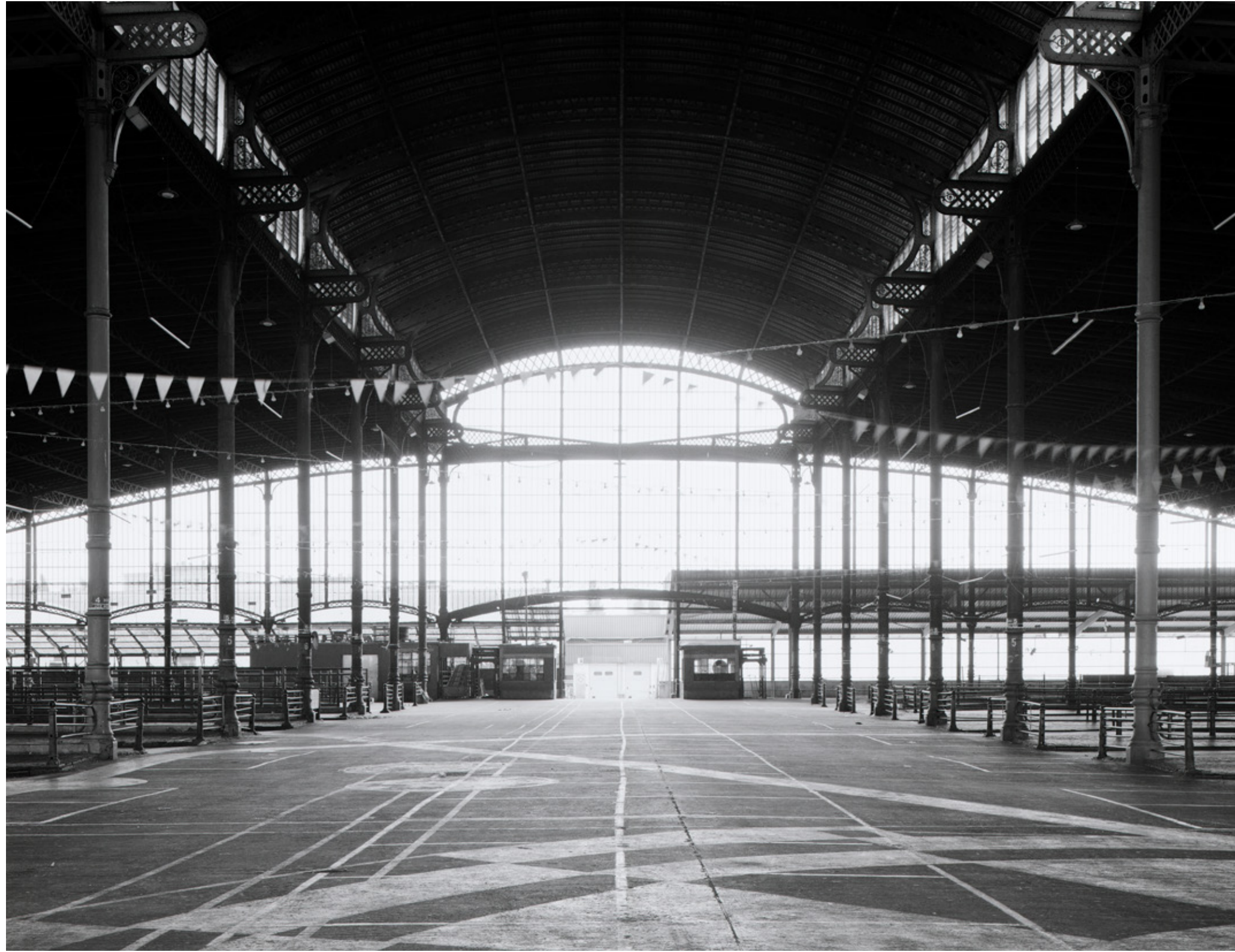
BRUXELLES_ 2017 PLAN CANAL #017 - 2017