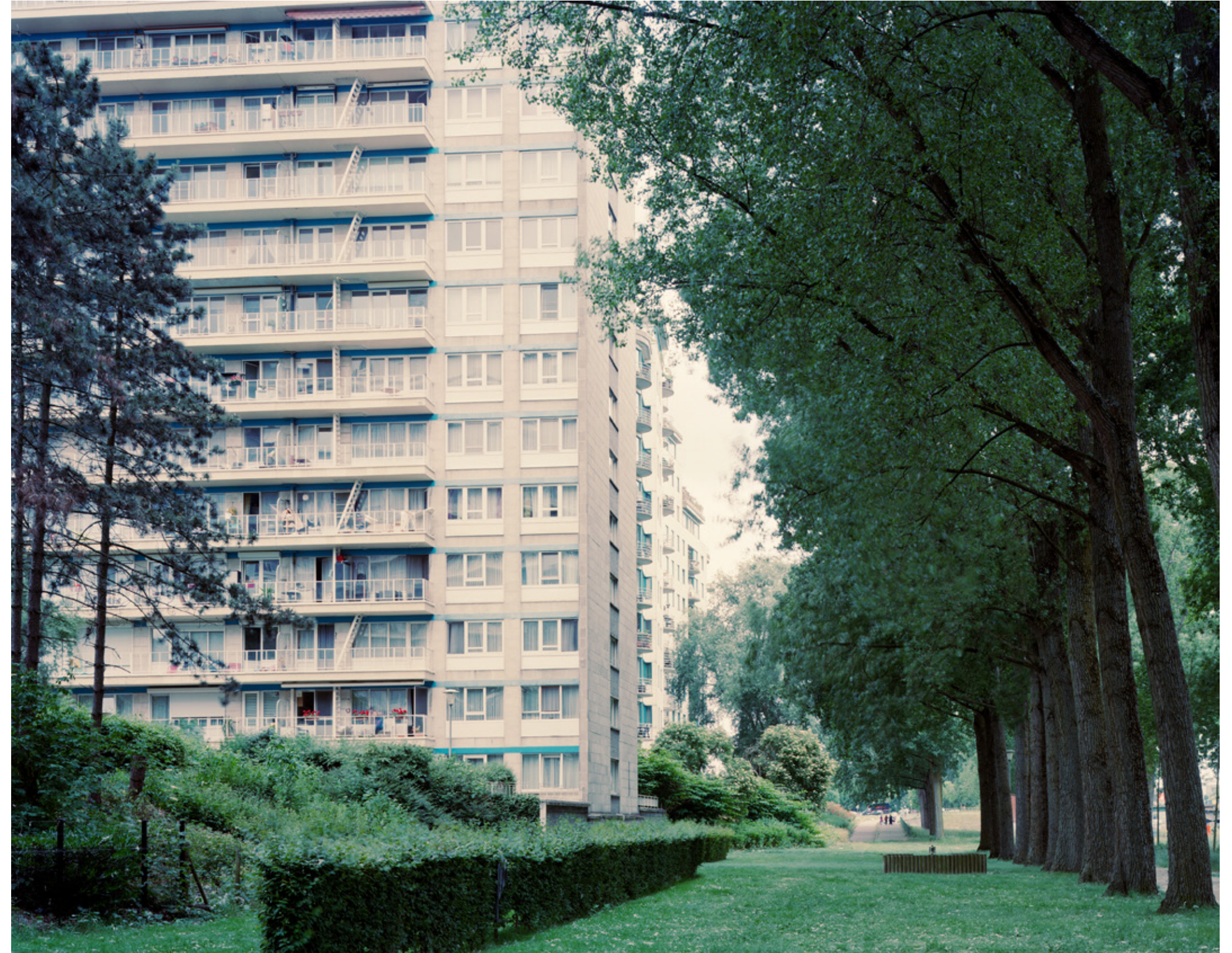
BRUXELLES_ 2017 PLAN CANAL #034 - 2017