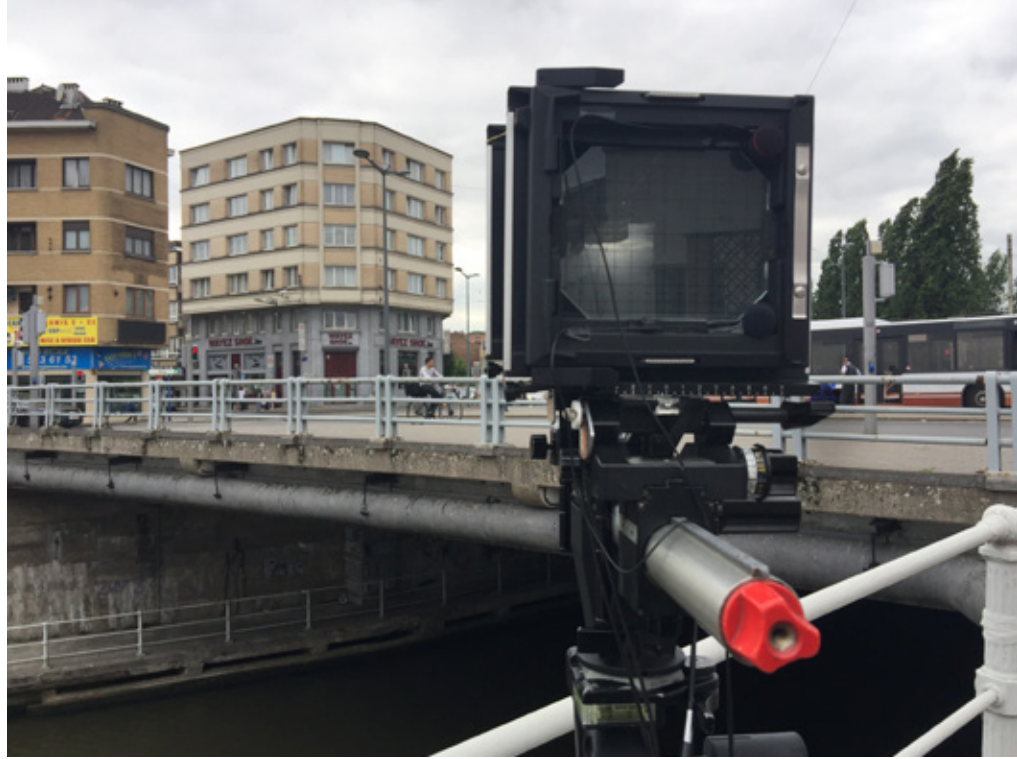
BRUXELLES_2017 PLAN CANAL #022 - 2017