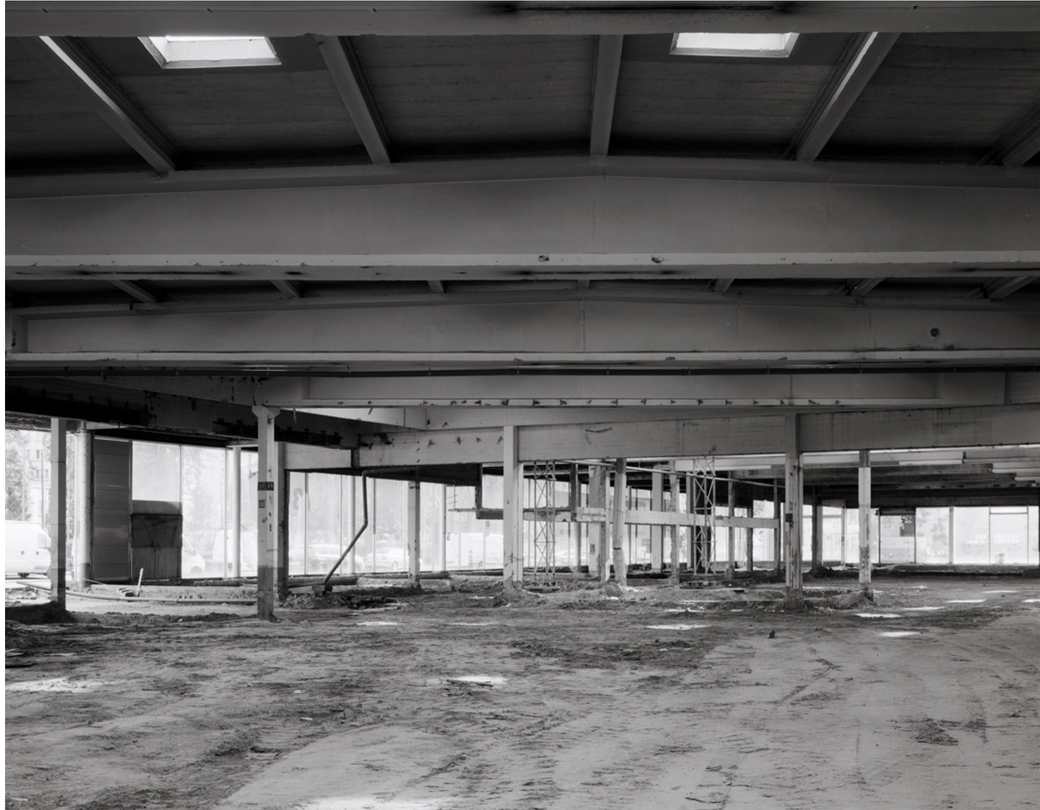
BRUXELLES_2017 PLAN CANAL #014 - 2017