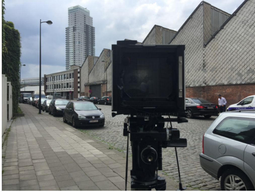
BRUXELLES_2017 PLAN CANAL #005 - 2017