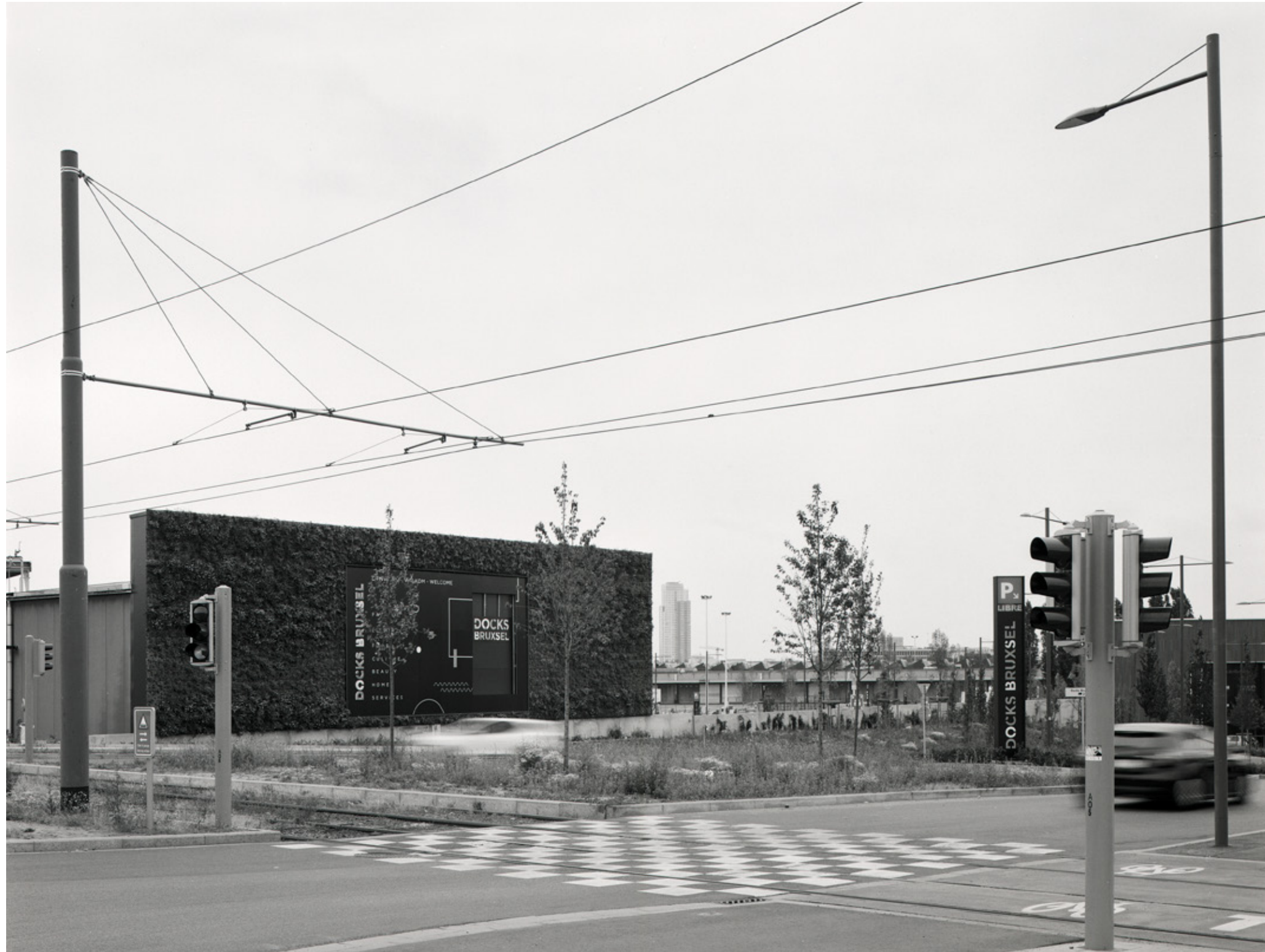
BRUXELLES_2017 PLAN CANAL #009 - 2017