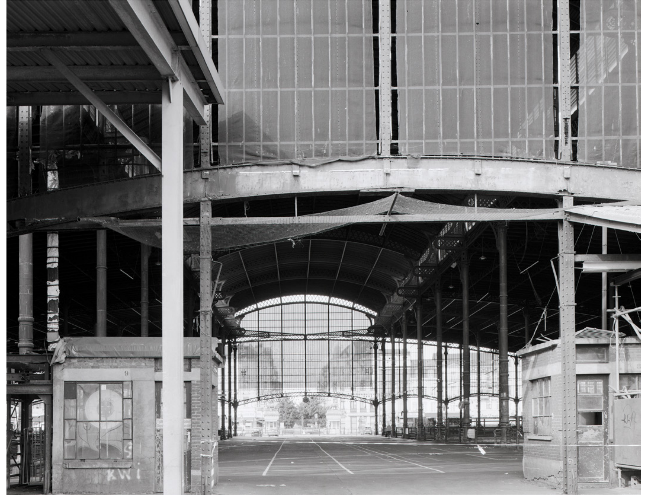
BRUXELLES_ 2017 PLAN CANAL #019 - 2017