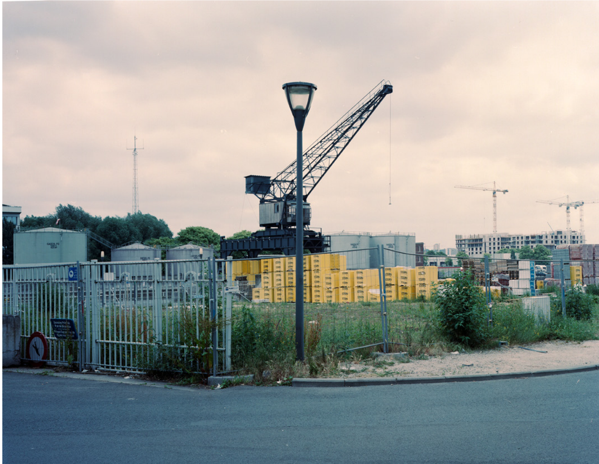
BRUXELLES_ 2017 PLAN CANAL #036 - 2017