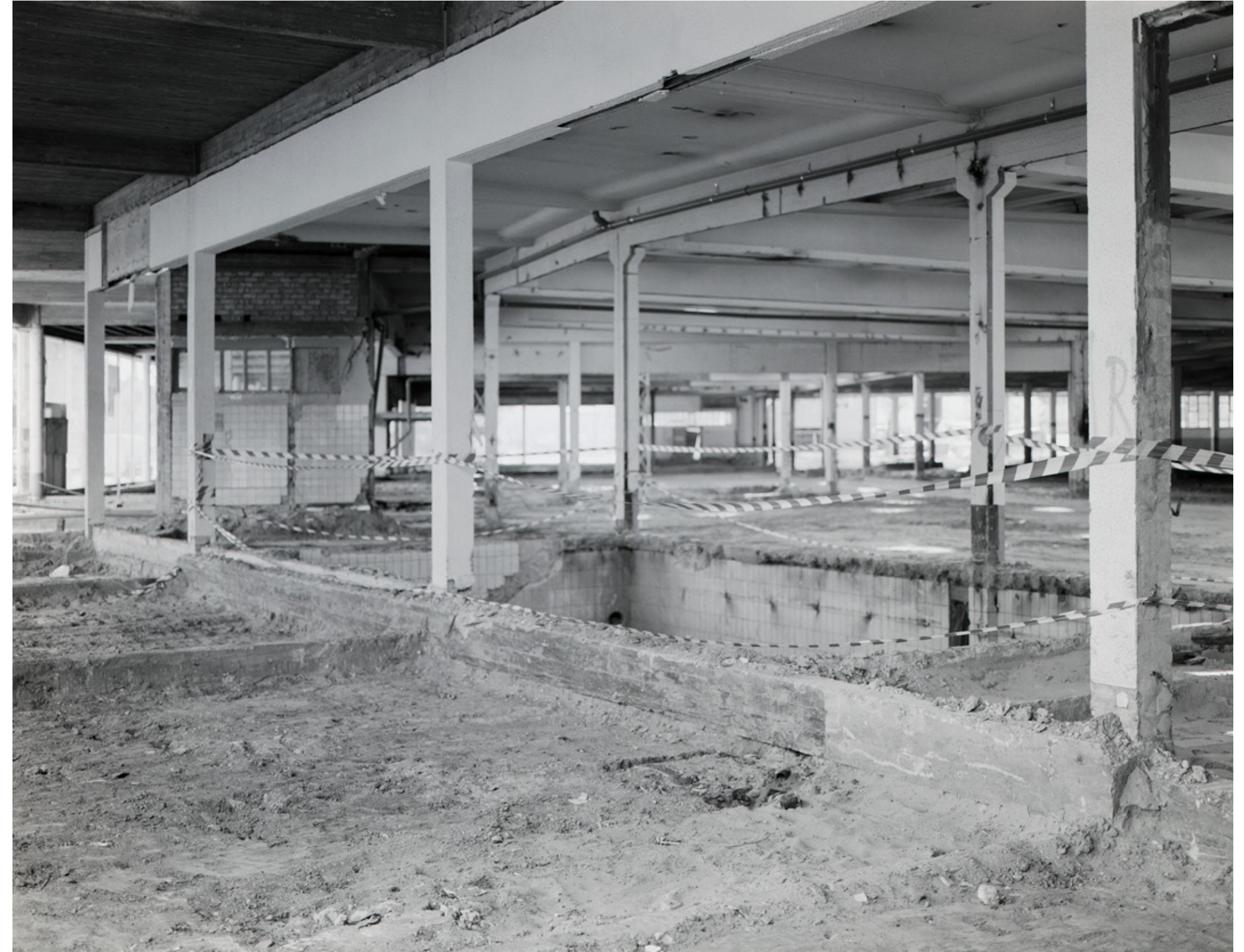
BRUXELLES_2017 PLAN CANAL #010 - 2017